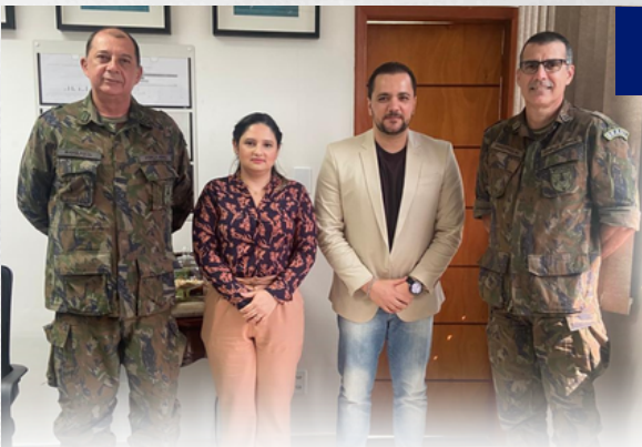
Hospital Beneficente Português realiza visita ao Hospital de Aeronáutica de Manaus