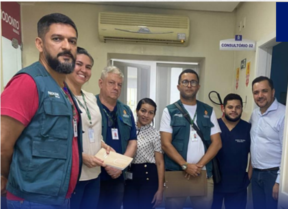
PROCON-AM realiza fiscalização no Pronto Atendimento do Hospital Beneficente Português